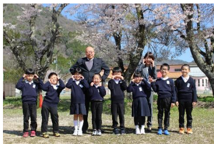
【2年生・にじいろ学級】

本年度も、保護者、地域の皆様方のご理解・ご協力を賜りますよう、よろしくお願いたします。